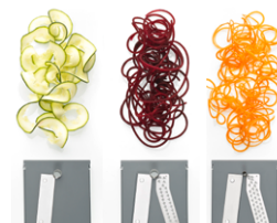
a b c