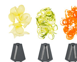
a b c