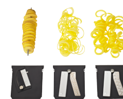
a b c