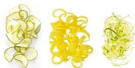
a b c